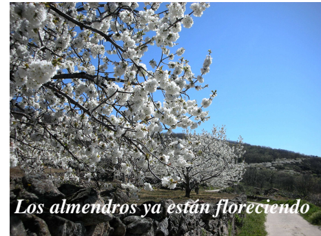
Los almendros ya están floreciendo