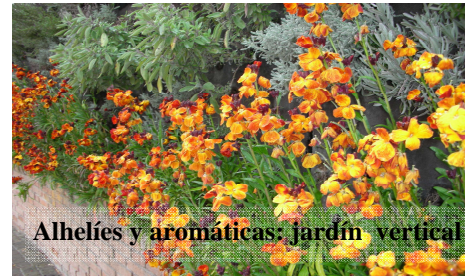
Alhelíes y aromáticas: jardín vertical