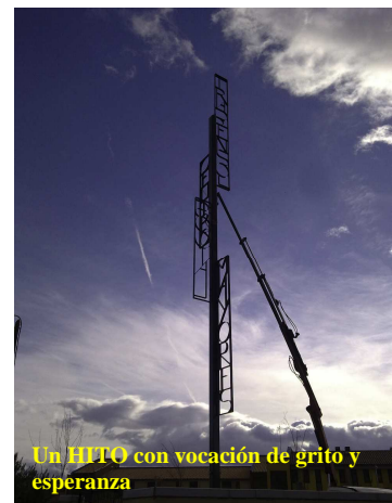
Un HITO con vocación de grito y esperanza