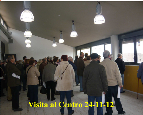
Visita al Centro 24-11-12

No es necesario explicar lo importante que es para la continuidad del proyecto TRABENSOL que los grandes medios de comunicación audiovisual se sigan interesando en él. Recientemente nuestras instalaciones han sido protagonistas, ante las cámaras de Televisión Española, en dos importantes programas. El 30 de diciembre pasado en uno de los de mayor audiencia, Documentos TV, bajo el título de Finanzas éticas y, seguidamente, el 9 de enero, en "Para todos la 2". Éste último, desde los estudios de Barcelona.