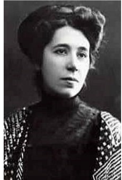
María de Lejárraga, a comienzos del s. XX