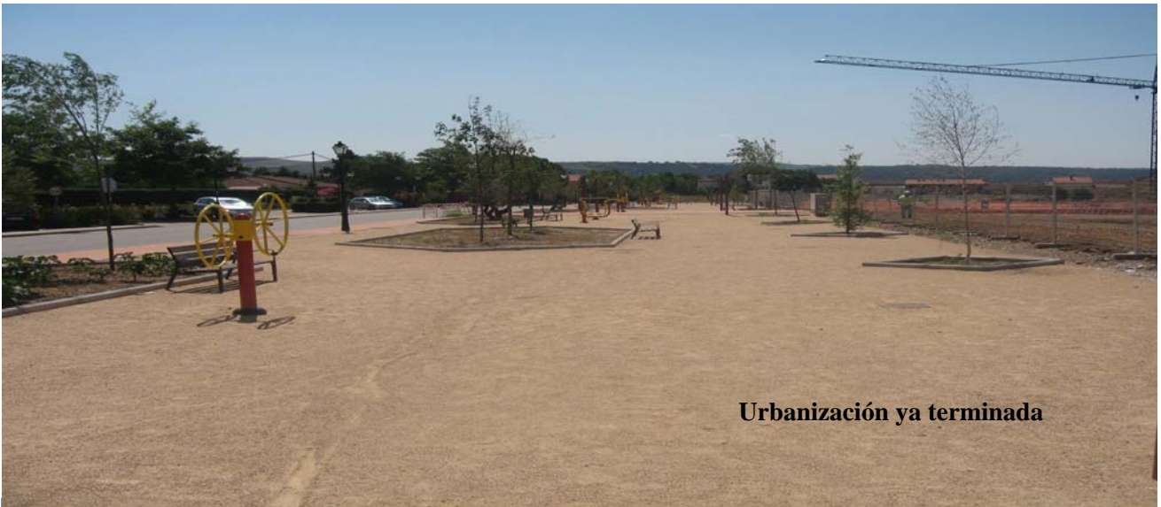
Urbanización ya terminada