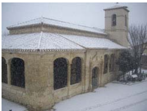
San Pedro de Torremocha con nieve

El Coro de Torremocha dará un concierto en la Iglesia de San Pedro Apóstol, el día de Año Nuevo a las 18:30 horas.