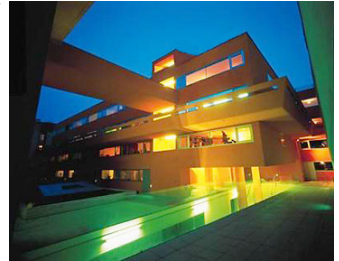
Su edificio. A ver cuando podemos hablar del nuestro...

Hemos estructurado los comentarios de los cooperativistas en distintos apartados que iremos mostrando según las posibilidades de nuestra hojita.